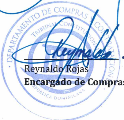
Reynaldo Rojas Encargado de Compras y Contrataciones