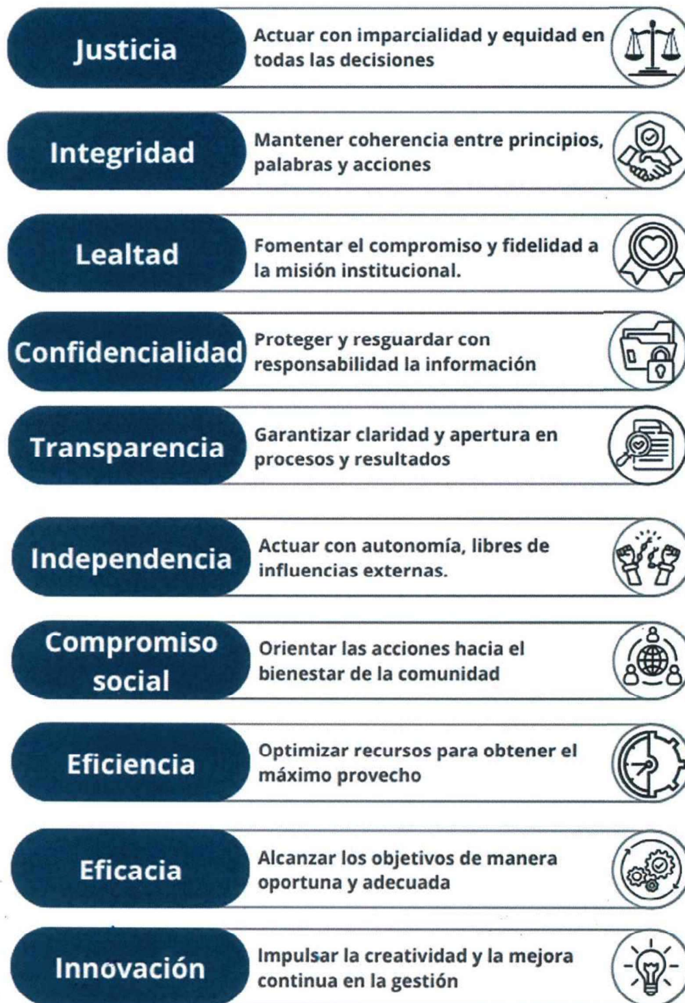
Figura No. 2: Valores del Tribunal Constitucional