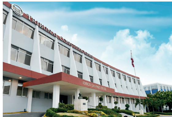
Sección frontal del Tribunal Constitucional de la República Dominicana