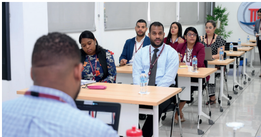
Personal del Tribunal Constitucional en el Taller de auditores internos ISO 9001:2015