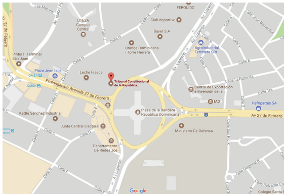
Ave. 27 de Febrero esq. ave. Gregorio Luperón, Santo Domingo Oeste, Provincia Santo Domingo, Rep. Dom.