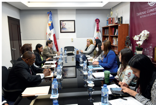
Reunión de apertura de la Auditoría de Seguimiento de la norma ISO 9001:2015