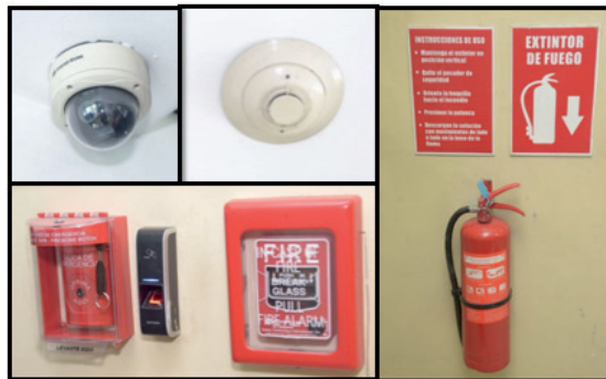
Equipos de seguridad instalados en el Tribunal Constitucional

De igual modo, se ha capacitado el personal interno, para sensibilizarlo y prepararlo para ejecutar un plan de acción frente a siniestros.