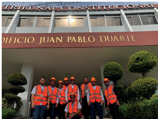
Integrantes del equipo de Brigada del Tribunal Constitucional

Para la protección de los servidores constitucionales y la ciudadanía que visita las instalaciones del Tribunal Constitucional, se han instalado equipos de seguridad tales como: cámaras de seguridad, extintores, alarmas contra incendios, hidrantes de incendios, entre otros.