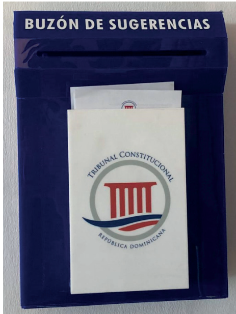
Buzón de quejas, sugerencias y reclamaciones del Tribunal Constitucional