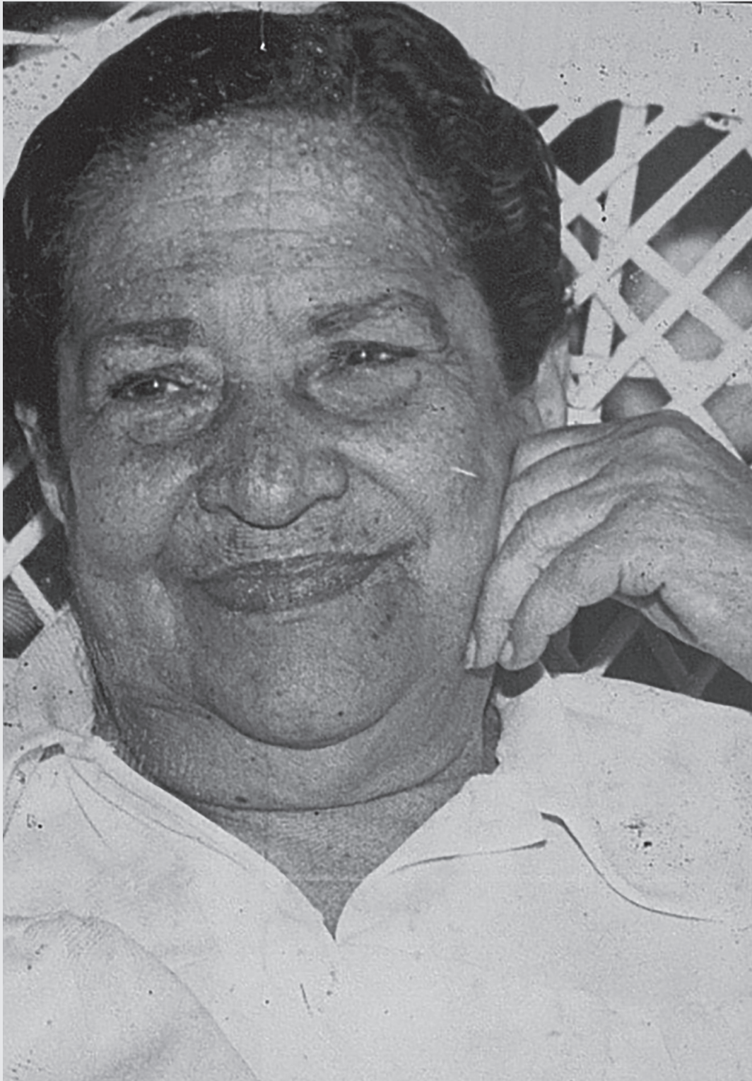
Aída Cartagena Portalatín