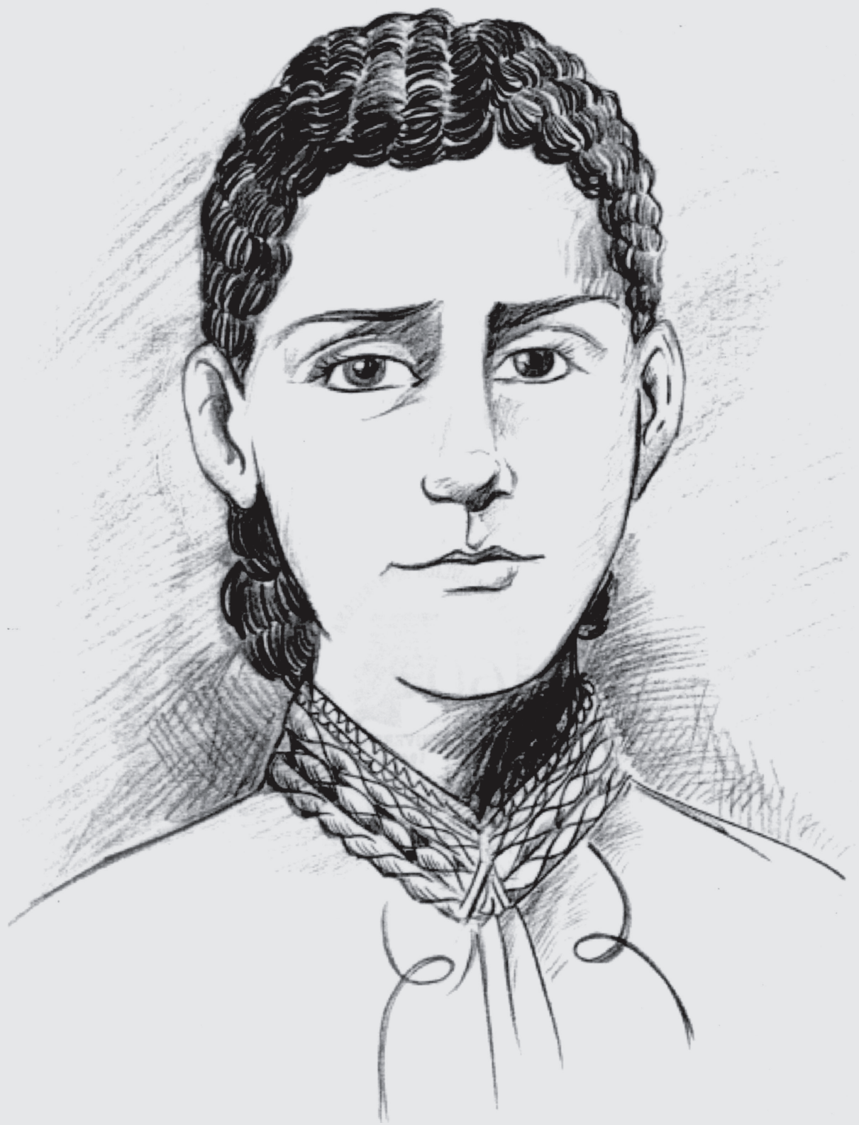
María Trinidad Sánchez