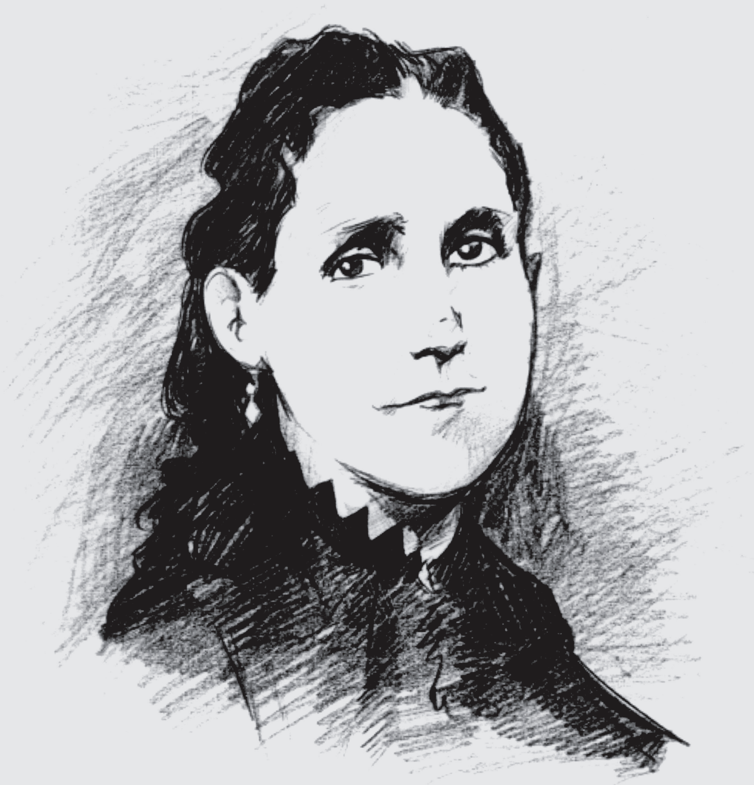
Rosa Protomártir Duarte y Díez