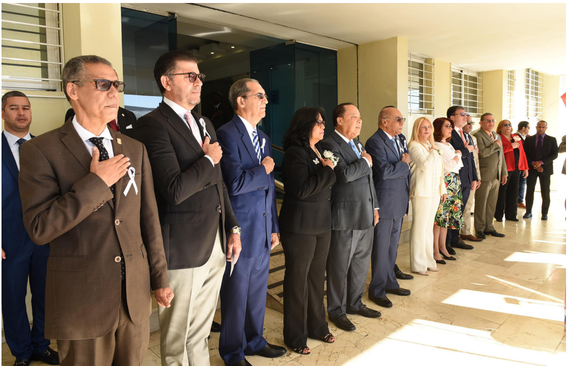
Jueces y juezas en el acto institucional en conmemoración del Día Internacional de la Mujer, 8 de marzo.