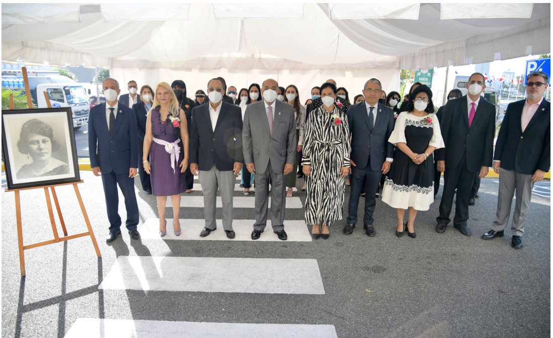
Jueces y juezas del Tribunal Constitucional en el acto de conmemoración del Día Internacional de la Mujer, 8 de marzo.