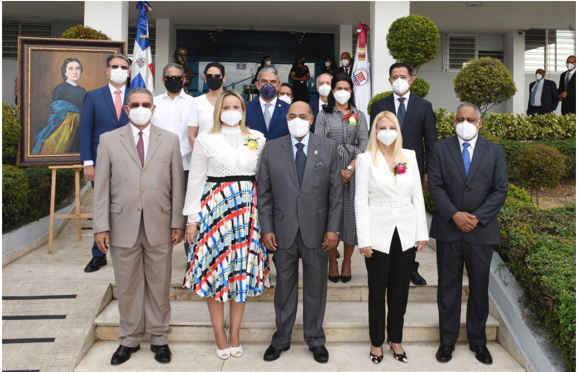
Jueces y juezas del Tribunal Constitucional, en el acto en conmemoración del Día Internacional de la Mujer, 8 de marzo.