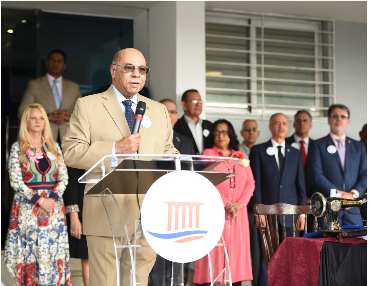
Día Internacional de la Mujer, en homenaje a María Trinidad Sánchez