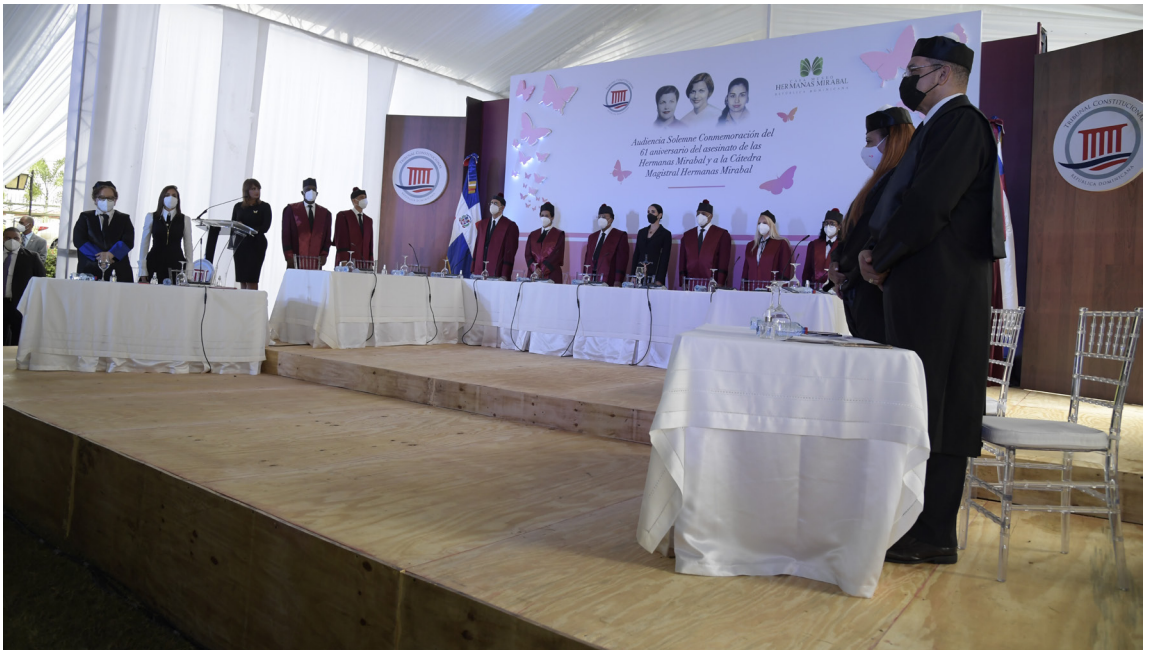
Audiencia solemne en conmemoración del Día Internacional de la Eliminación de la Violencia contra la Mujer, 25 de noviembre de 2021, Casa Museo Hermanas Mirabal, Salcedo, provincia Hermanas Mirabal, República Dominicana