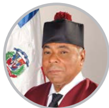
Milton Ray Guevara Juez Presidente