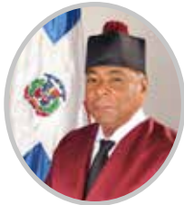
Milton Ray Guevara Juez Presidente